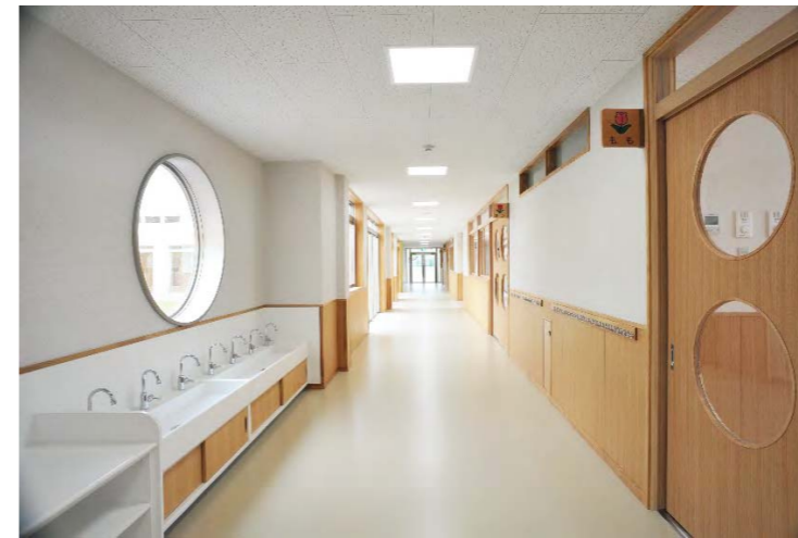
中庭を囲う明るい回廊