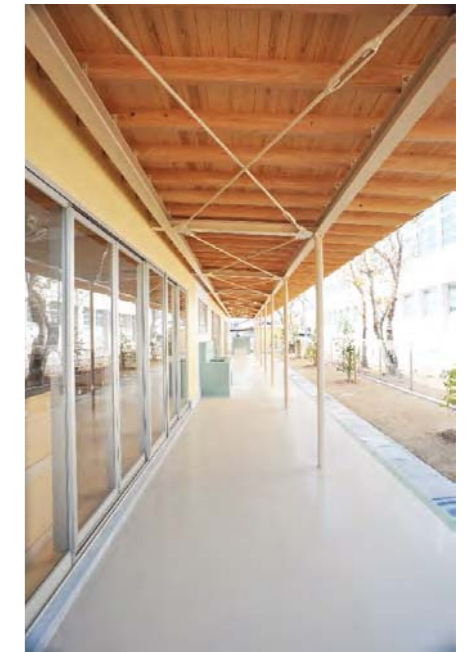
内と外をつなぐ中間領域の形成