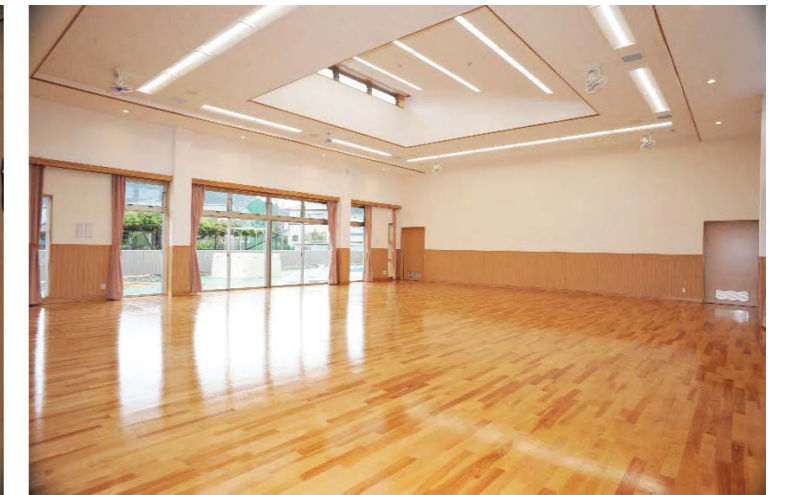
天井の高い明るい遊戯室