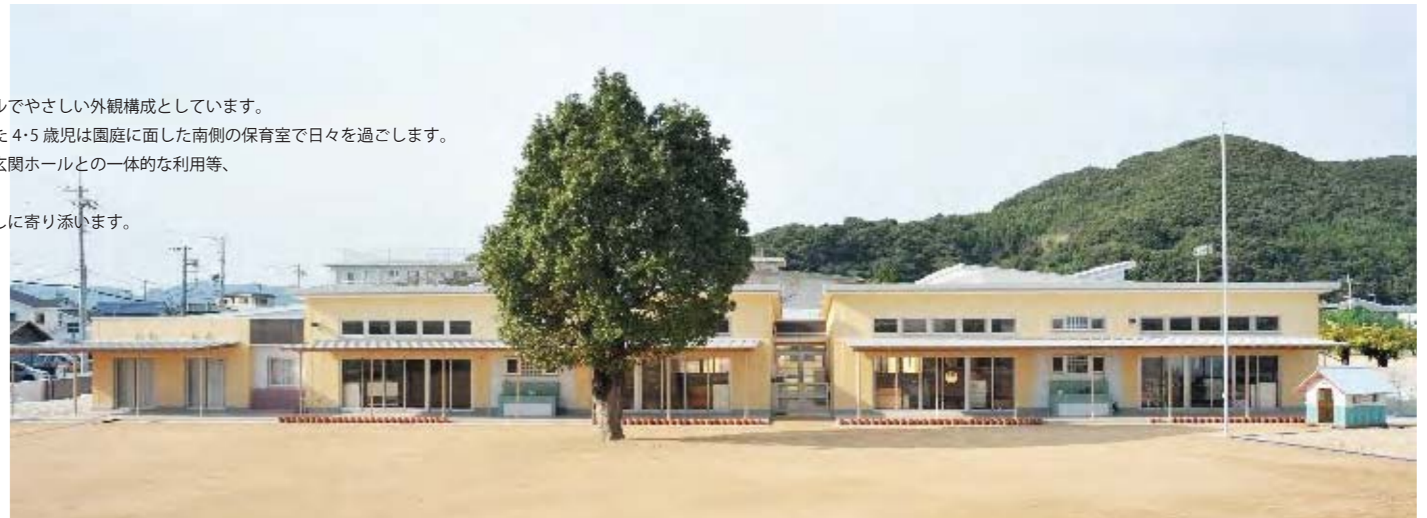
園庭からみた園舎の様子